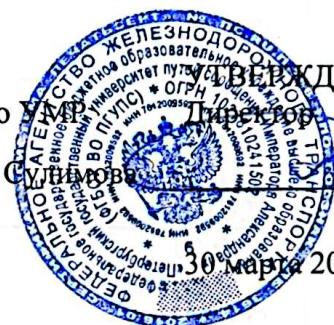
График государственной итоговой аттестации обучающихся группы Т-3/4-103 очной формы обучения специальности 23.02.06 Техническая эксплуатация подвижного состава железных дорог в форме государственного экзамена